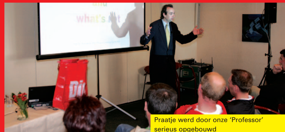
Praatje werd door onze 'Professor' serieus opgebouwd

All-round professional met een sterk gevoel voor humor