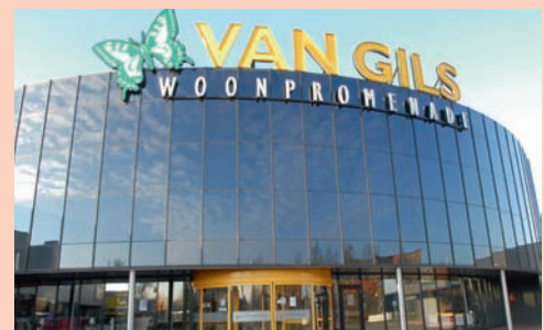
Het pand van Van Gils Woonpromenade in Oldenzaal

'Wat in ieder geval voor zowel Nederlanders als Duitsers geldt: ze gaan voor kwaliteit. En dan kom je bij De Munk Carpets aan je trekken: gemaakt van honderd procent wol en op maat te maken, erg belangrijk! Bovendien zijn de medewerkers prettig in de omgang.'