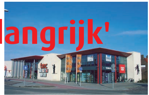
Het pand van TMC in Goes