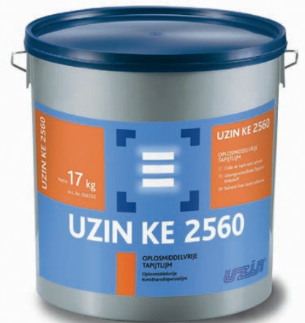
'Uzin' heeft haar tapijtlijm vernieuwd

Ter gelegenheid van het jubileum presenteert Unipro de 'Uzin'-selectie. 'Speciaal voor de projectinrichter selecteerden we een aantal kwaliteitsproducten'.