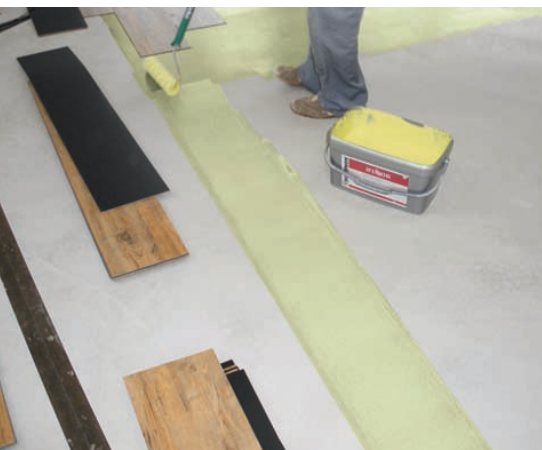
'iFloor', een emissiearme, rolbare dispersiekleefstof