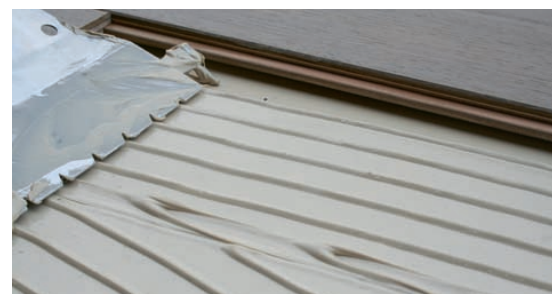
De lijm wordt met een speciale lijmkam aangebracht

hoge aanhechtingskleefkracht, ook toe te passen op voorstrijkmiddel met vochtscherm 'Lecol Express Primer PU280' en op iedere ondergrond toe te passen. De lijm wordt geleverd in een kuststof verpakking van 15 kilogram met een folielaag. Informatie: Lecol/Maiburg, +31 (0)416 - 566 540