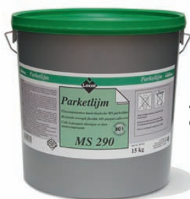
Lecol meldt de introductie van een nieuwe parketlijm, 'MS290'

ting, het draadtrekkende vermogen en de dimensiestabiliteit wordt geprezen. Dat laatste houdt in dat het product voor alle linoleum-soorten geschikt is. De tapijtlijm is na de opknopbeurt beter te verwerken. 'KE2560' biedt een hoge beginhechting en een lager verbruik dan voorheen. Beide lijmen zijn verkrijg-