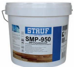
Polymeerlijm en vochtscherm in één: Stauf SMP-950

De Stauf-lijm is geschikt voor alle ondergronden, is zeer emissiearm en bevat geen weekmakers. Het verbruik is 900-1.150 gram per vierkante meter bij normaal gebruik en 1.800 g/m 2 als vochtscherm, volgens opgave van PPC. Deze lijm is ver-