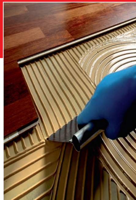
Eén van de producten van Mapei, Ultrabond Eco S955, voor alle soorten parket