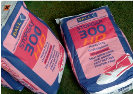
Stopgap 300 HD van F-Ball

De Britten kondigen een investeringsprogramma van 8 miljoen euro aan in een nieuwe fabriek en een nieuw instructiecentrum. 'Hiervan zullen al onze