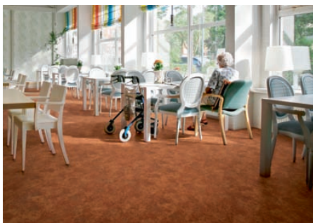
'Calgary', de nieuwe kwaliteit in de 'Flotex Classic'-collectie

'De stand bestaat uit een wand waarin in vijf kleursferen toepassingen van onze producten in de segmenten zorg, onderwijs, kantoor, retail en leisure getoond worden. Daarnaast introduceren we met name de nieuwe 'Flotex'- en 'Coral'-collectie', aldus De Widt.