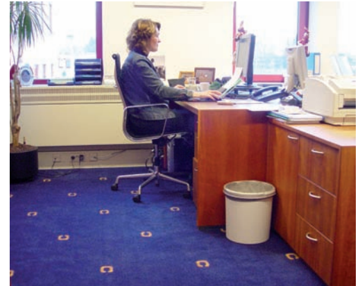
Een voorbeeld van tapijt met een eigen dessin, in dit geval bij Capital-C Ventures in Bunnik

Part 4 biedt acht kwaliteiten gordijnstof, die vanaf 50 meter van ieder dessin voorzien kunnen worden. 'Van speels tot druk, van kleurrijk tot rustig, alles is mogelijk', geeft Henk Heres aan. 'Wij werken met een uitstekend designersteam de gemaakte schet-