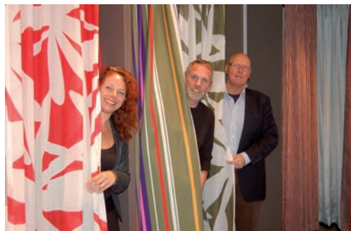
'Creativiteit en onderscheidend vermogen zijn heel belangrijk, juist in deze moeilijke economische tijden'

mens Willard aan. Laatstgenoemde vertelt dat zijn organisatie al langer de mogelijkheid biedt om door klanten ontworpen dessins op vloerbedekkingen toe te passen. 'Maar door dit nieuwe initiatief kunnen wij hier meer aandacht aan schenken. Onze producten, gordijnen en vloerbedekking, passen natuurlijk ook uitstekend bij elkaar. En door ze custom made te maken, geven we de producten een eigen dimensie.'